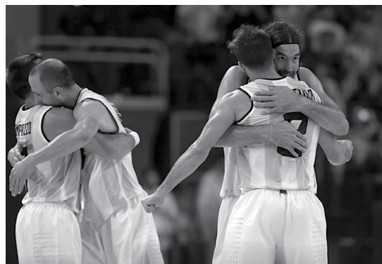
A seleção da Argentina estará em duelo com equipe brasileira na tarde de hoje nos Jogos Olímpicos