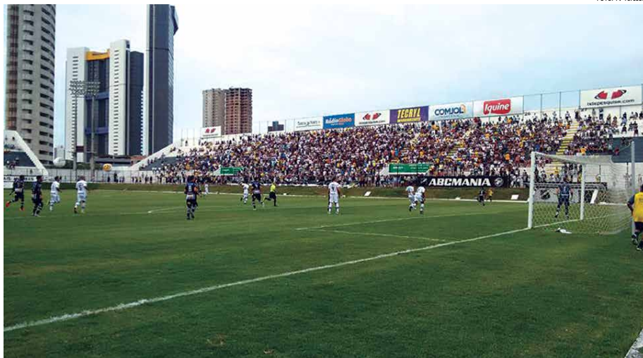
Botafogo, que no último jogo empatou com o ABC-RN, vai enfrentar o vice-líder do Brasileiro da Série C pensando em vitória e em ocupar a liderança do seu grupo

Outra questão importante em relação a esta partida é que, pela posição estratégica no G4, os dois clubes precisam de