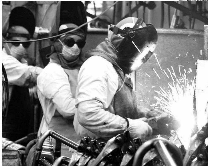
Produção industrial puxou o resultado favorável da economia no segundo trimestre desse ano, crescendo 1,1% frente a maio

"Para frente, os indicadores antecedentes apontam para um nível de atividade econômica acima do que temos atualmente no cenário, sugerindo um viés de alta para nossas projeções de PIB no terceiro trimestre", disse o documento assinado pelo economista do banco Rodrigo Miyamoto.